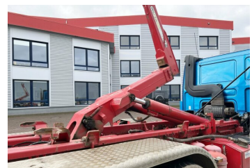
gassmann trucks More than 2.000 trucks & trailers