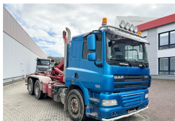
gassmann trucks More than 2.000 trucks & trailers

., Multifunktionslenkrad, Außenspiegel anklappbar