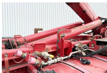
gassmann trucks More than 2.000 trucks & trailers