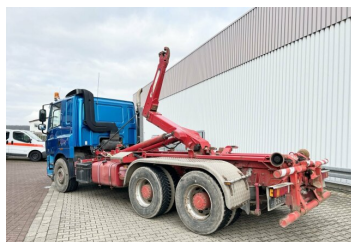
gassmann trucks More than 2.000 trucks & trailers