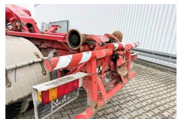
gassmann trucks More than 2.000 trucks & trailers