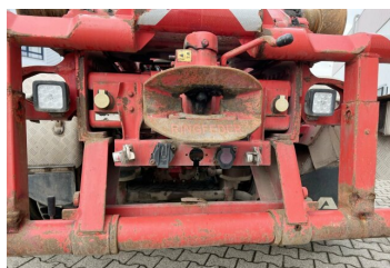
gassmann trucks More than 2.000 trucks & trailers