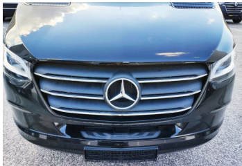
Thomann Nutzfahrzeuge GmbH