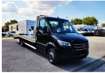
Thomann Nutzfahrzeuge GmbH