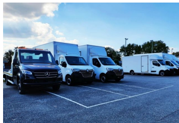
Thomann Nutzfahrzeuge GmbH