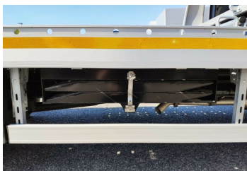
Thomann Nutzfahrzeuge GmbH