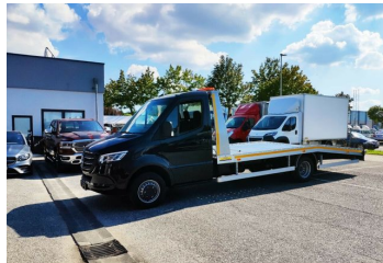
Thomann Nutzfahrzeuge GmbH