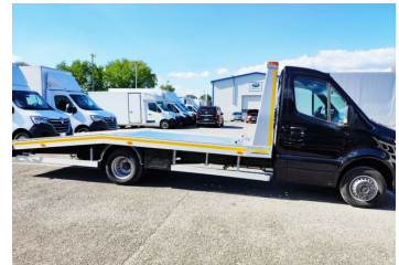
Thomann Nutzfahrzeuge GmbH