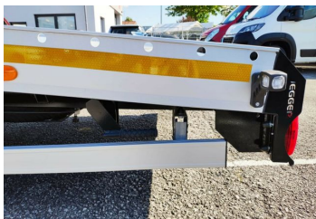
Thomann Nutzfahrzeuge GmbH