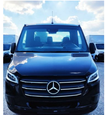
Thomann Nutzfahrzeuge GmbH