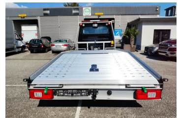
Thomann Nutzfahrzeuge GmbH