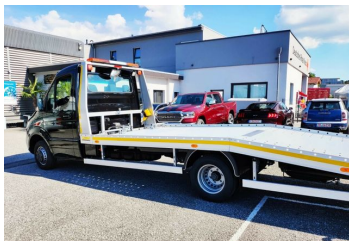
Thomann Nutzfahrzeuge GmbH