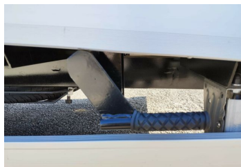
Thomann Nutzfahrzeuge GmbH