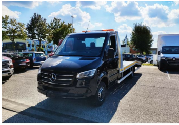
Thomann Nutzfahrzeuge GmbH

überprüfen Sie die Richtigkeit der Ausstattungsmerkmale vor dem Kauf direkt am Fahrzeug. Irrtümer / Zwischenverkauf vorbehalten. Diese Anzeige ist als Aufforderung zur Abgabe eines Angebots zu verstehen., Start-Stop-Automatik, Bluetooth Freisprecheinrichtung