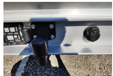
Thomann Nutzfahrzeuge GmbH