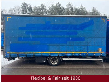
Flexibel & Fair seit 1980