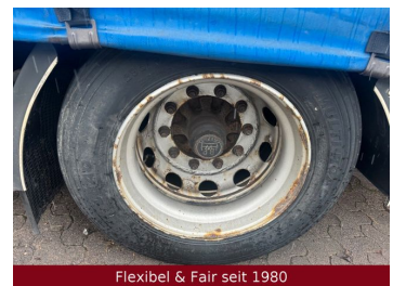
Flexibel & Fair seit 1980