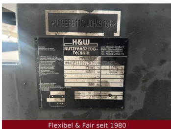
Flexibel & Fair seit 1980