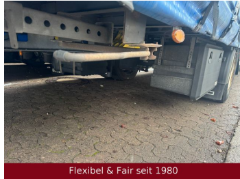
Flexibel & Fair seit 1980