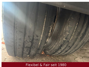
Flexibel & Fair seit 1980