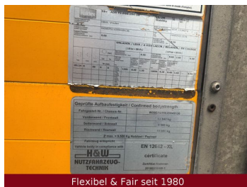
Flexibel & Fair seit 1980