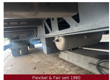
Flexibel & Fair seit 1980