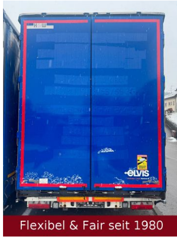
Flexibel & Fair seit 1980