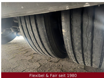
Flexibel & Fair seit 1980