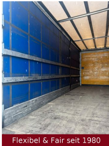
Flexibel & Fair seit 1980