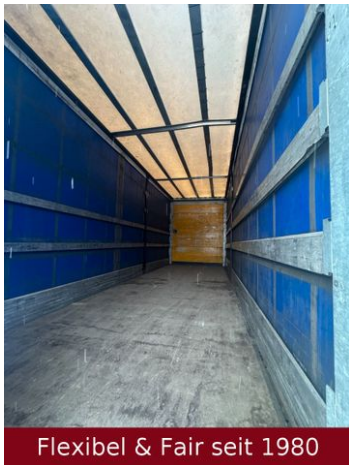
Flexibel & Fair seit 1980