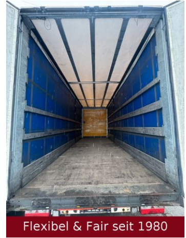
Flexibel & Fair seit 1980