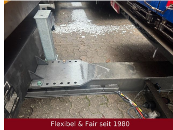
Flexibel & Fair seit 1980